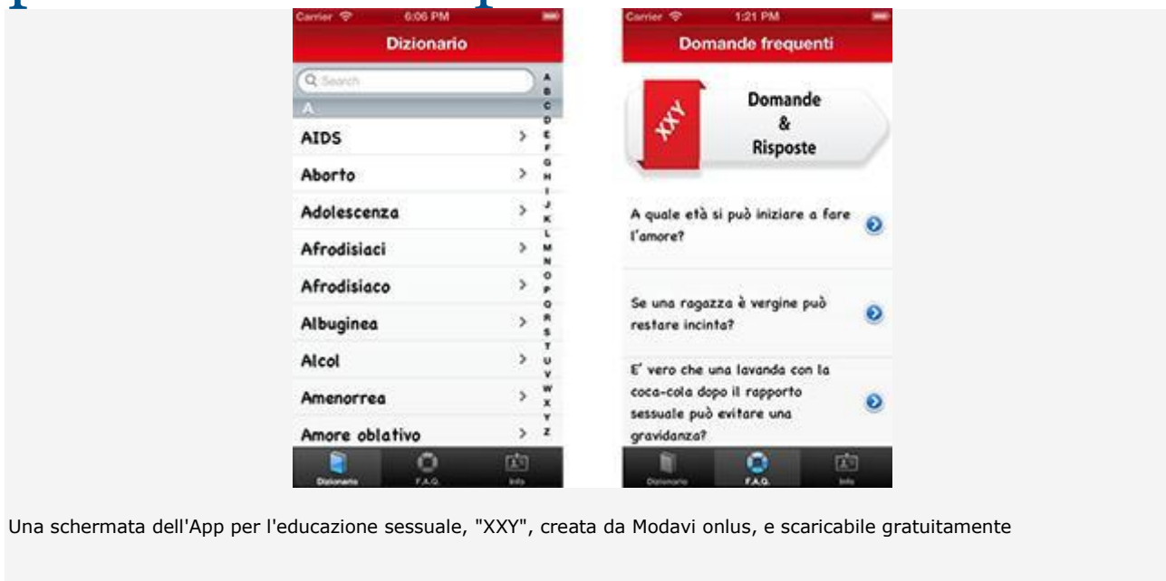
Una schermata dell'App per l'educazione sessuale, "XXY", creata da Modavi onlus, e scaricabile gratuitamente

Da Modavi onlus, grazie al contributo del Ministero del Lavoro e delle Politiche Sociali, arriva l'App gratuita per smartphone dedicata all'educazione sessuale