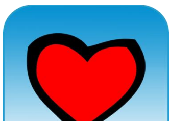
L'icona dell'app XXY

Modavi onlus lancia un'app gratuita con domande e risposte sulla sessualità. È abbastanza per fare "educazione sessuale"?